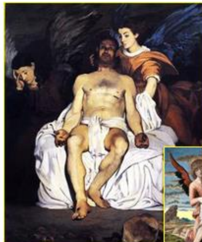
Édouard Manet, Totter Christus mit Engeln (1864)