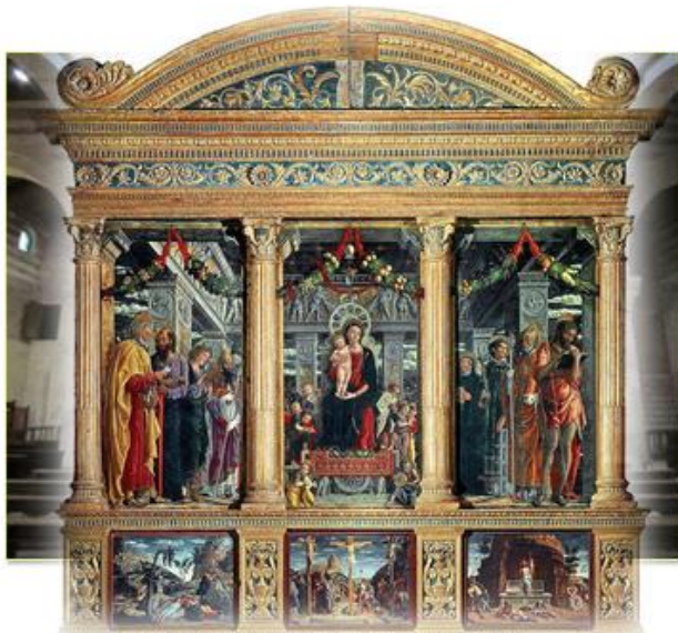
Andrea Mantegna, Altar in St.Zeno, Verona (1457-60)