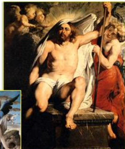
Peter Paul Rubens, 1616