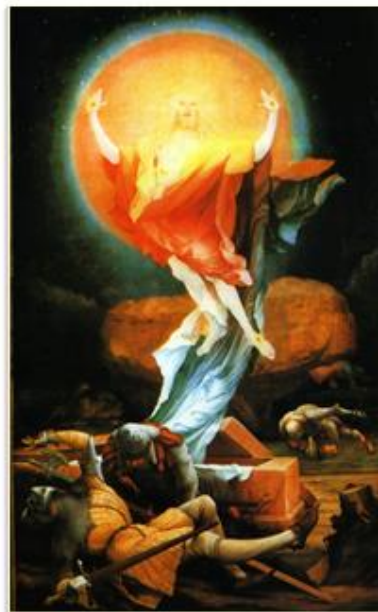
Matthias Grünewald (1506-15)