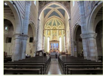
Andrea Mantegna, Altar in St.Zeno, Verona (1457-60)