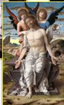
Andrea Mantegna: Engelspietà (um 1495/1500)