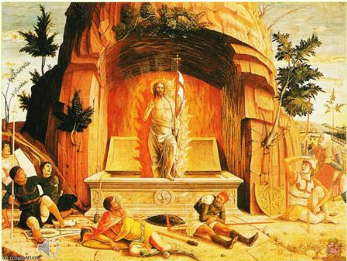
Andrea Mantegna, Altar in St.Zeno, Verona (1457-60)