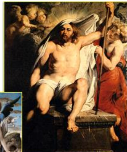
Peter Paul Rubens, 1616