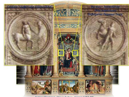
Andrea Mantegna, Altar in St.Zeno, Verona (1457-60)