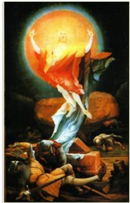
Matthias Grünewald, Colmar, Isenheimer Altar (1506-15)